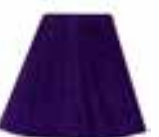
Violet Night™ HCR 11043