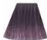
Amethyst Ashes™ HCR 11077