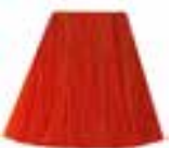
Electric Lava™ HCR 11034