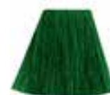
Venus Envy™ HCR 11045