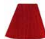
Wildfire™ HCR 11010