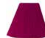
Cleo Rose™ HCR 11046