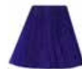
Ultra™ Violet HCR 11031