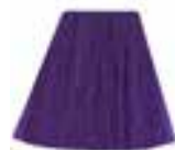
Electric Amethyst™ HCR 11036