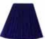
Shocking™ Blue HCR 11028