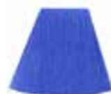
Bad Boy™ Blue HCR 11017