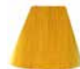
Sunshine™ HCR 11040