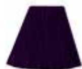
Deep Purple Dream™ HCR 11048