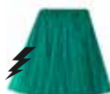
Mermaid™ HCR 11025