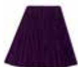
Plum Passion™ HCR 11021