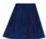
After Midnight™ HCR 11001