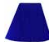
Rockabilly™ Blue HCR 11039