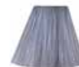
Blue Steel™ HCR 11052