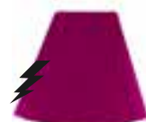
Hot Hot™ Pink HCR 11015