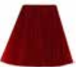
Rock 'N' Roll™ Red HCR 11035