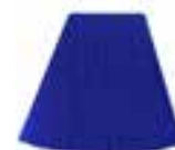
Blue Moon™ HCR 11041