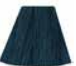
Voodoo Forest™ MEU11051 *EU ONLY* (Made in the EU)