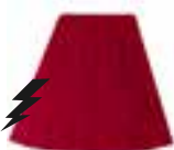
Red Passion™ HCR 11050