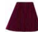
Fuschia Shock™ HCR 11013