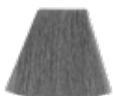
Alien Grey™ HCR 11061