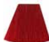
Pillarbox™ Red HCR 11020