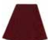
Infra™ Red HCR 11016