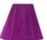
Mystic Heather™ HCR 11018