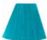
Atomic™ Turquoise HCR 11002