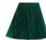
Enchanted Forest™ HCR 11009