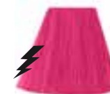
Cotton Candy™ Pink HCR 11004