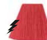
Pretty Flamingo™ HCR 11023