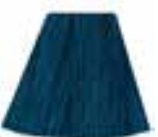
Voodoo™ Blue HCR 11038 *USA ONLY*