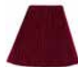
Vampire™ Red HCR 11032