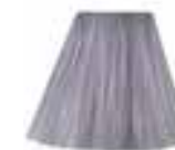
Silver Stiletto® HCR 11006