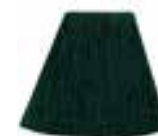
Green Envy™ HCR 11014 *USA ONLY*