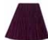
Purple Haze™ HCR 11024