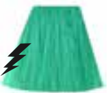
Siren's Song™ HCR 11049