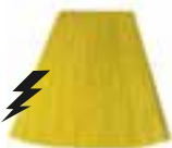
Electric Banana™ HCR 11012