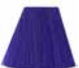
Lie Locks™ HCR 11019