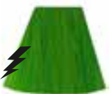
Electric Lizard™ HCR 11029