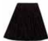
Raven™ HCR 11007