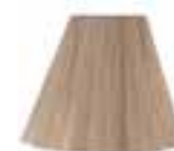
Virgin Snow™ (Toner) HCR 11033 *USA ONLY*

GARANTÍA DE SER VEGANOS. CRUELTY FREE · PARABEN-FREE · GLUTEN-FREE · AMMONIA-FREE · RESORCINOL-FREE · PPD-FREE · PHTHALATE-FREE · HECHOS EN USA/EU