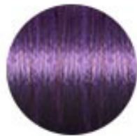
LOVE POWER PURPLE