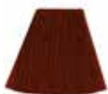
Vampire's Kiss™ HCR 11042