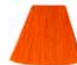
Psychedelic Sunset™ HCR 11044