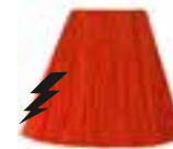
Electric Tiger Lily™ HCR 11037